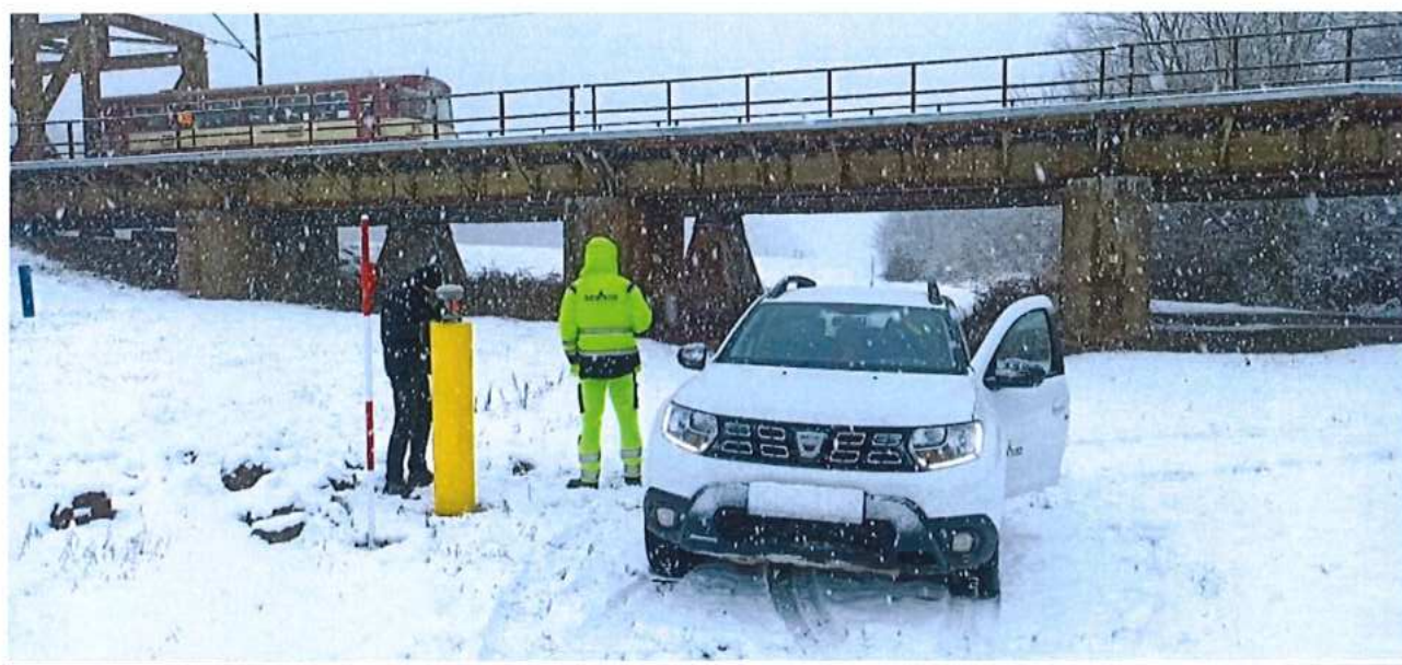
Bodovanie ZVS - úsek Kúty (mimo) – št. hranica, GNSS – statická metóda