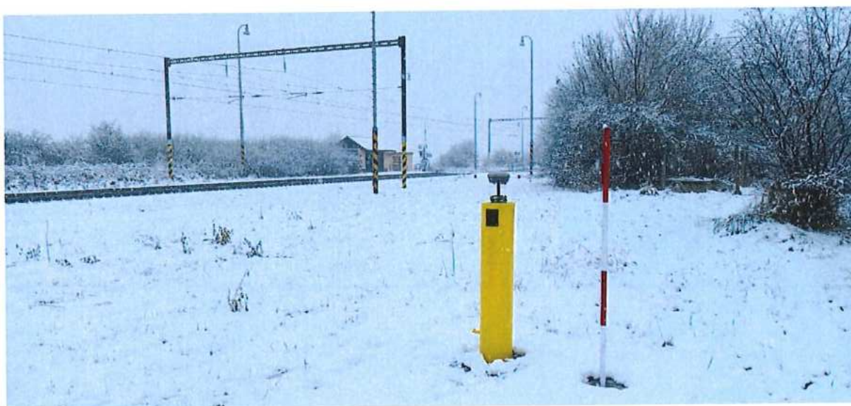
obr. 2 , úsek Kúty (mimo) – štátna hranica, pažnica - bod ZVS