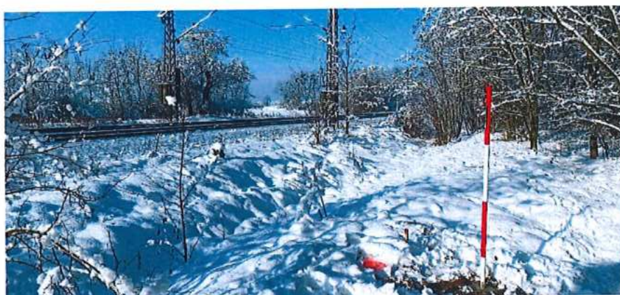
Obr. 3 obr. 2 , úsek Kúty (mimo) – štátna hranica, GNSS meranie – statická metóda