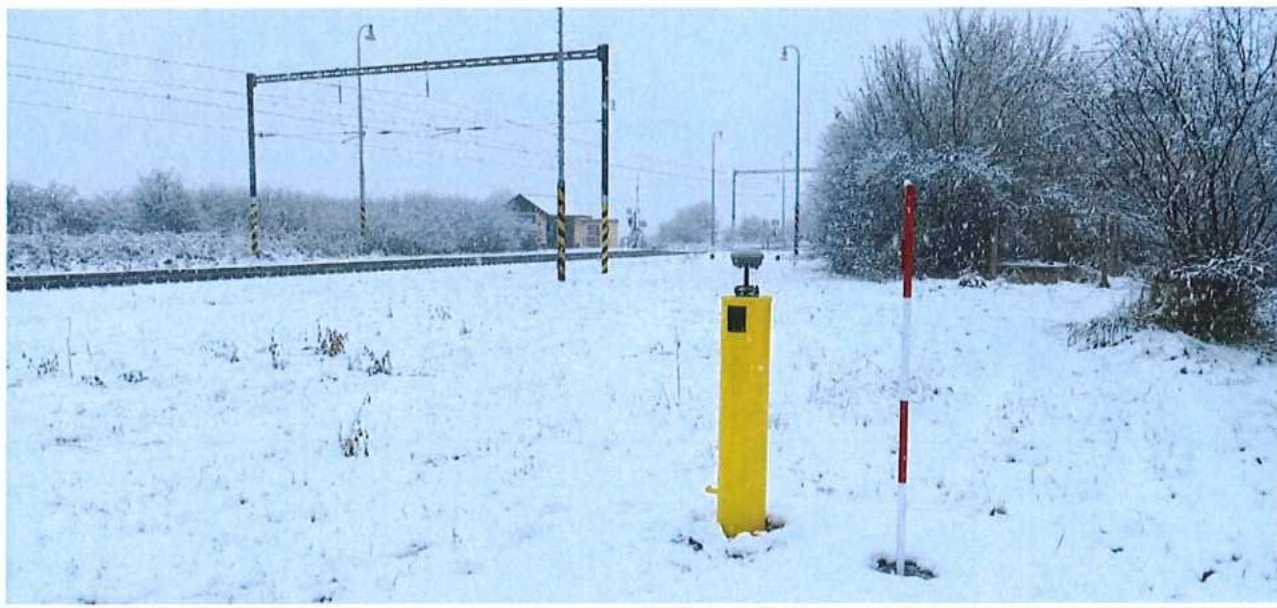
Bodovanie ZVS – úsek Kúty (mimo) – št. hranica, zast. Brodské